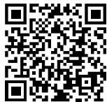
Neueste Version zum Herunterladen

DuPont Packaging Graphics beweist erneut seine globale Position als führender Lieferant innovativer Lösungen für den Flexodruck. Auf der Basis neuester Technologien hat unsere Forschung verbesserte Lösungen in der Druckformherstellung entwickelt, die es unseren Kunden ermöglichen in neue profitable Flexo-Marktsegmente vorzustoßen. Das Produkt Portfolio umfasst Cyrel® Fotopolymerplatten ( analog und digital), Cyrel® Geräte zur Plattenherstellung, Cyrel®_round Sleeves , Cyrel® Montagesysteme sowie das revolutionäre thermische Cyrel® FAST System .